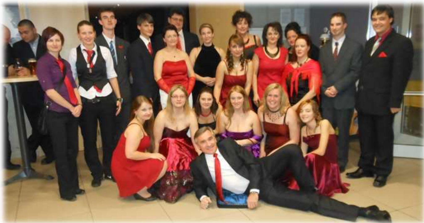
Benefiční galavečer ČČK 2013