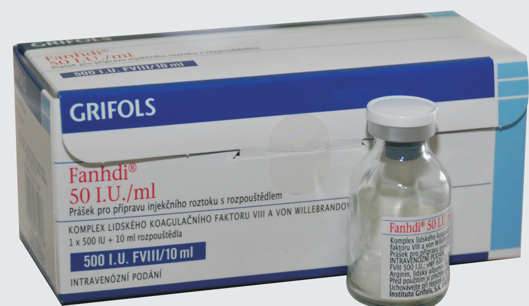
Fanhdi 50 I.U.

na životě. Léčba je celoživotní (podává se na hematologickém oddělení).