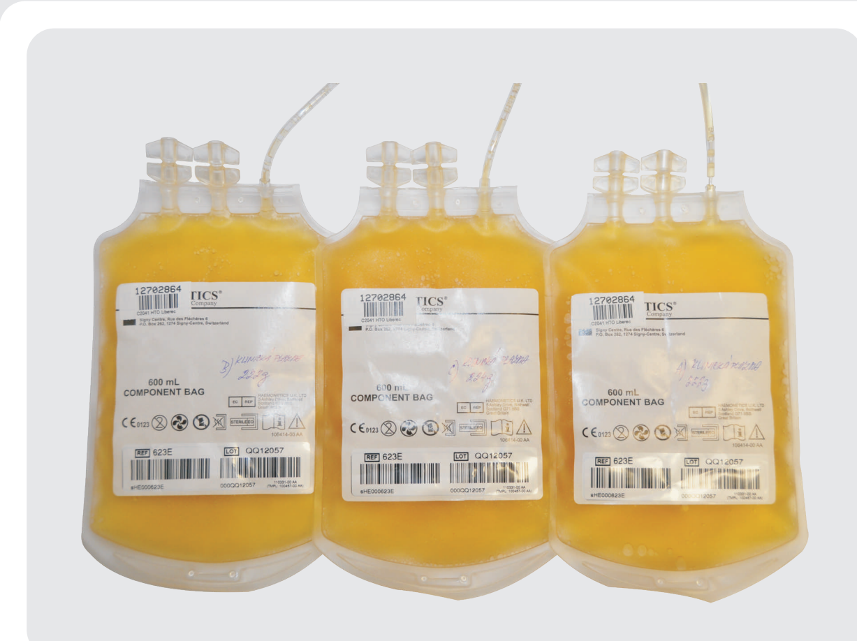
Plazma ke klinickému užití

Po 6 měsíčním skladování a po opakovaném vyšetření dárce se plazma používá k transfuzím u pacientů například při krváceních, velkých úrazech a při operacích.