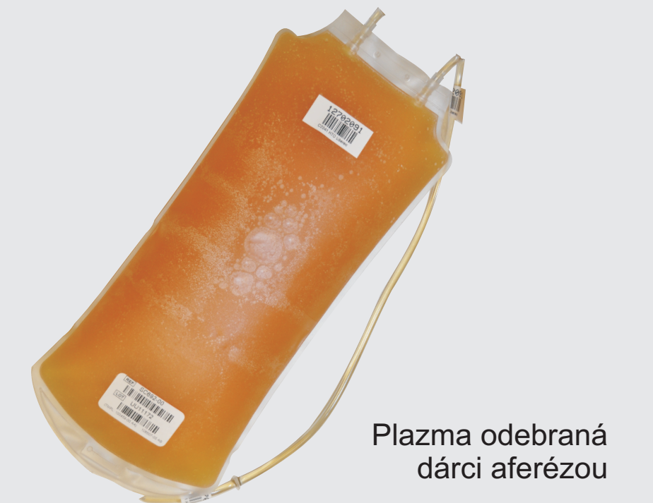
Plazma odebraná dárce aferézou

DÁRCOVSTVÍ PLAZMY MÁ PRO LÉČBU NAŠICH PACIENTŮ PODOBNÝ VÝZNAM JAKO DÁRCOVSTVÍ PLNÉ KRVE. PLAZMA ODEBRANÁ NA KREVNÍM SEPARÁTORU, STEJNĚ JAKO PLAZMA VYROBENÁ Z PLNÉ KRVE MÁ DVA MOŽNÉ OSUDY: