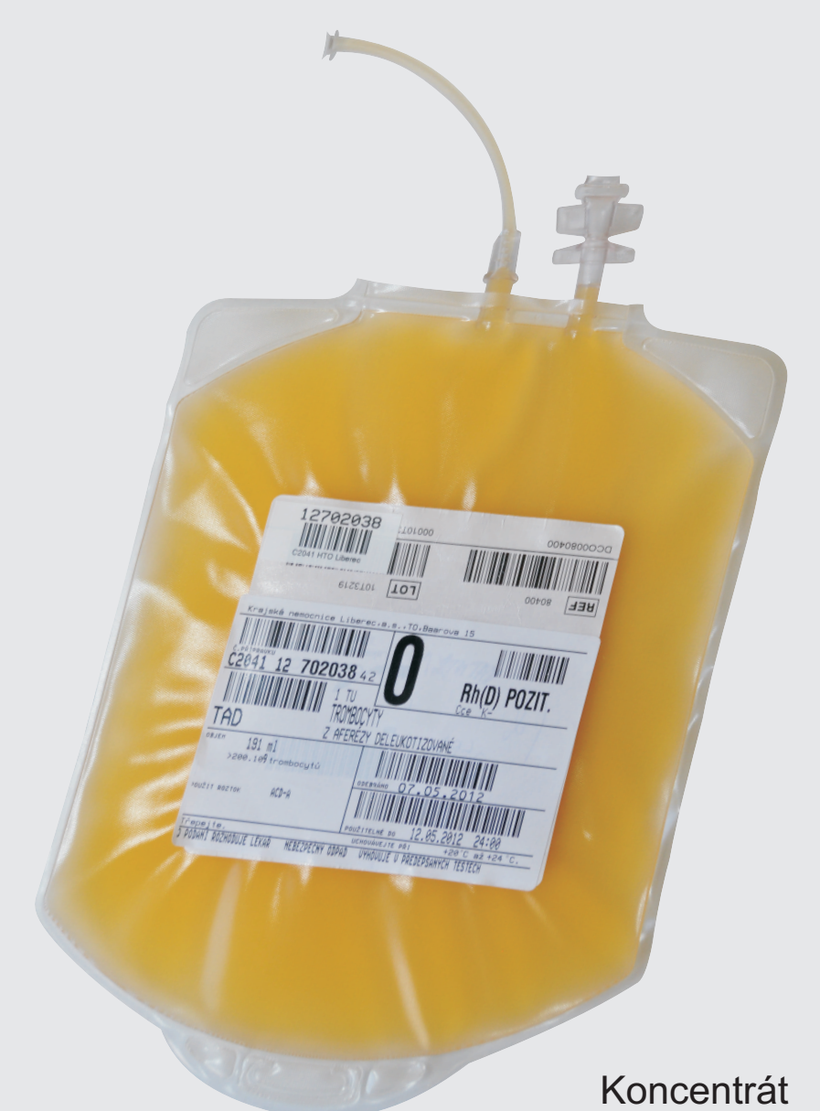
Koncentrát krevních destiček

Koncentráty krevních destiček se podávají pacientům, kteří mají nedostatek krevních destiček nebo mají krevní destičky nefunkční (například při podávání některých léků). Podávají se hlavně na hematologii, onkologii, traumatologii, anesteziologicko-resuscitačním oddělení pacientům s krvácením po úrazech, při operacích, pacientům s chorobami krvetvorby nebo se zhoubnými nádory.