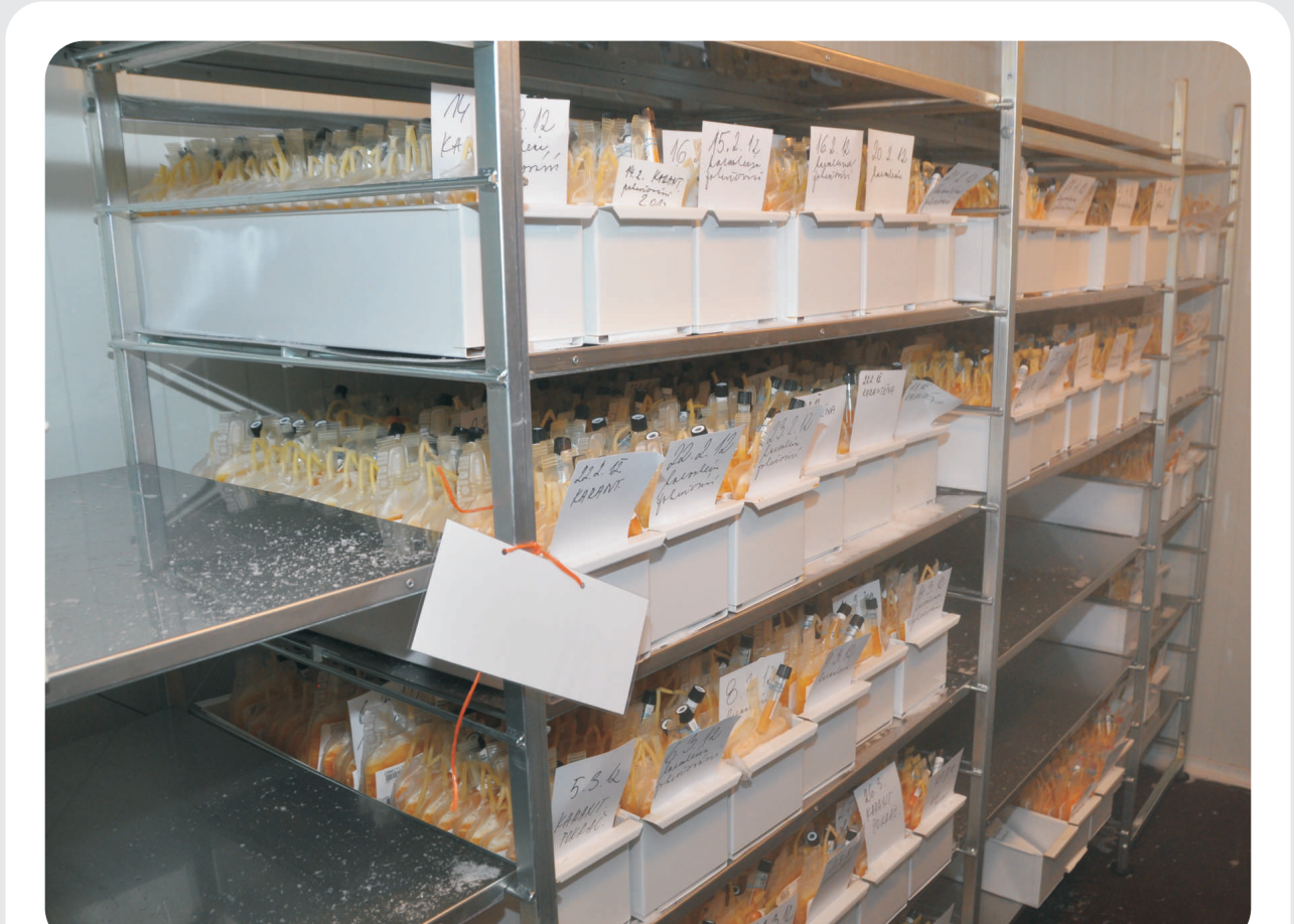
Skladování plazmy v mrazicím boxu při teplotě -25 °C