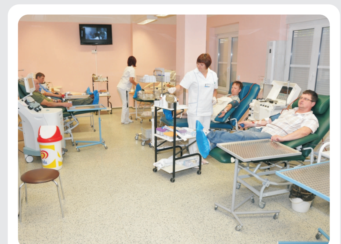
Odběrový sál transfuzního oddělení KNL

V případě zájmu o dárcovství plazmy se informujte na vyšetřovnách při vyšetření k odběru.